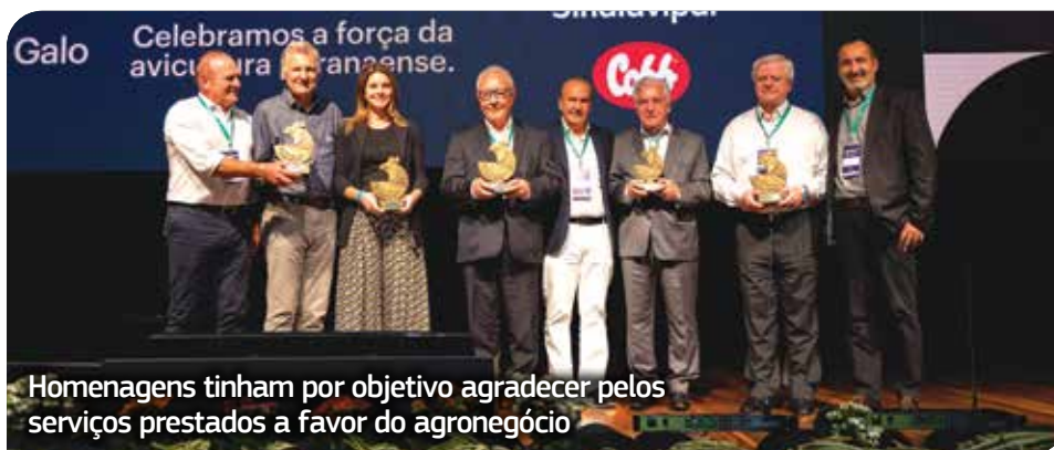
Homenagens tinham por objetivo agradecer pelos serviços prestados a favor do agronegócio