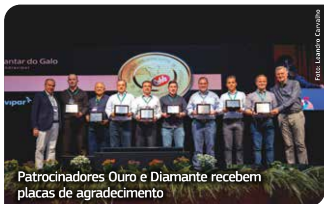
Patrocinadores Ouro e Diamante recebem placas de agradecimento