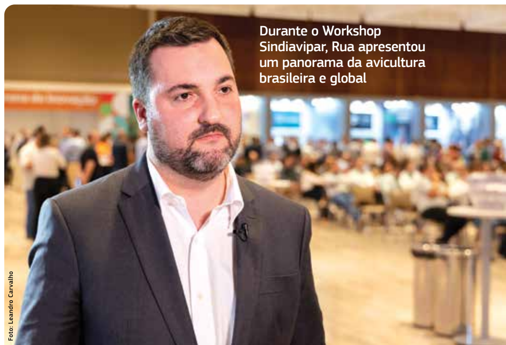
Durante o Workshop Sindiavipar, Rua apresentou um panorama da avicultura brasileira e global

Para 2023, a ABPA faz projeções de estabilidade na produção doméstica em comparação com 2021 e 2022. Já nas exportações, a previsão é de um leve aumento, chegando à marca de