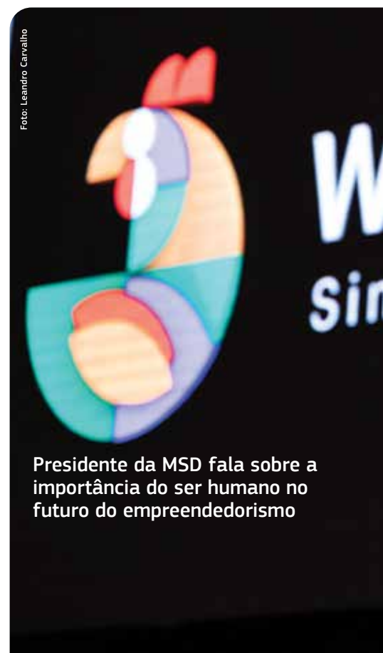
Presidente da MSD fala sobre a importância do ser humano no futuro do empreendedorismo