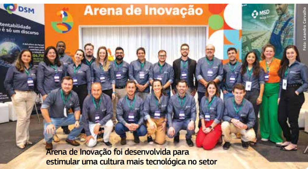
Arena de Inovação foi desenvolvida para estimular uma cultura mais tecnológica no setor

Entre as tecnologias apresentadas na Arena de Inovação, estão: o ábaco digital, um equipamento que permite mensurar e avaliar em tempo real a incidência das condenações das carcaças no Departamento de Inspeção Final (DIF); uma solução para monitoramento de ambiência dos aviários; e o monitoramento do consumo diário de ração por meio de sensores instalados nos silos que captam as informações em tempo real e auxiliam na compreensão da conversão alimentar. ●