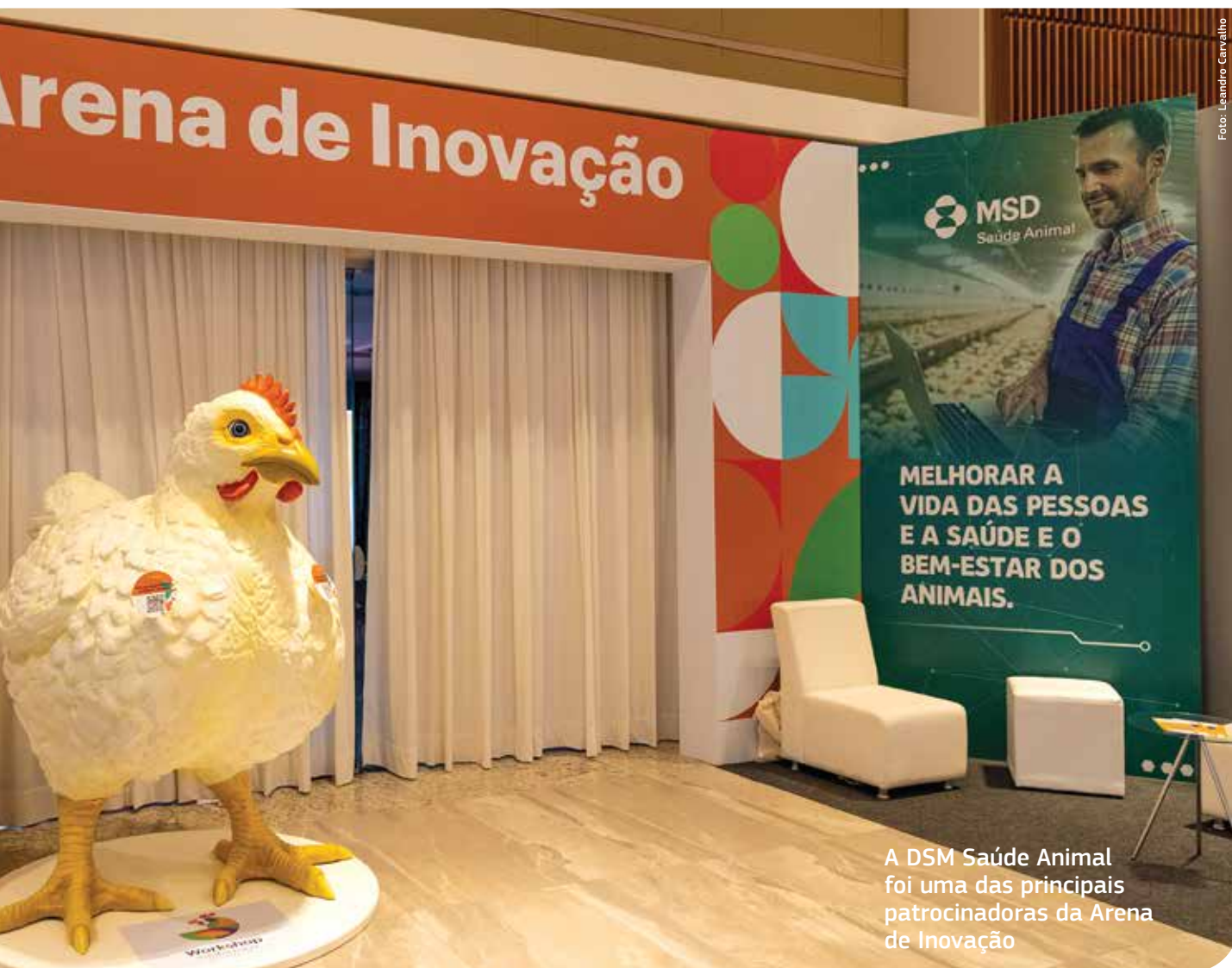
A DSM Saúde Animal foi uma das principais patrocinadoras da Arena de Inovação